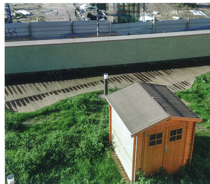
La toiture-terrasse de l'école combine platelage bois et jardin.

En façade, un bardage bois « ludoptique » comme le décrit l'architecte, offre une animation originale au bâtiment. Les lames sont en effet de teintes différentes selon l'angle d'observation. Couleur bois naturel vues de face, elles deviennent vertes ou oranges quand on les regarde de biais. Ce travail sur les cinq façades du groupe scolaire place les enfants au cœur de la démarche de son concepteur mais aussi, pourquoi pas, les passagers du RER D qui peuvent l'apercevoir pendant leur trajet, entre les stations Gare du Nord et Stade de France. ●