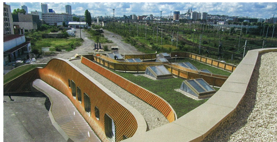
La forme de la toiture ne compte aucun angle.

En termes de réalisation, arrondir les angles nécessite un travail de préparation important car « tous les composants des systèmes d'étanchéité doivent s'adapter au dessin imposé », rappelle Jérémie Joseph-François, en charge des travaux pour l'entreprise Axe Étanchéité. C'est d'ailleurs pourquoi le choix de la membrane d'étanchéité s'est porté sur une feuille en FPO posée en indépendance, dont l'élasticité et la maniabilité s'adaptent aux formes complexes. De plus, toutes les couvertines en aluminium et les bandes pare-gravier ont été cintrées. Pour façonner les cercles végétalisés, des cornières de 40/10° ont été découpées selon les calculs d'un géomètre, tout comme l'isolant en polystyrène de 300 mm d'épaisseur. « Une étape compliquée car les outils standards sont trop courts pour réaliser en une seule fois des coupes franches », explique Jérémie Joseph-François. Chacune de ces opérations a